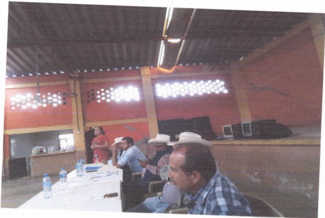
ASISTENCIA A LA REUNION DE EJIDATARIOS EJIDO TUXCUECA, ASUNTO INFORMACION DE COMO SE EJECUTARA EL RECURSO DEL APOYO A CASAS EJIDALES DEL GOBIERNO DEL ESTADO ATRAVES DE LA SECRETARIA DE AGRICULTURA Y DESARROLLO RURAL DEL ESTADO.