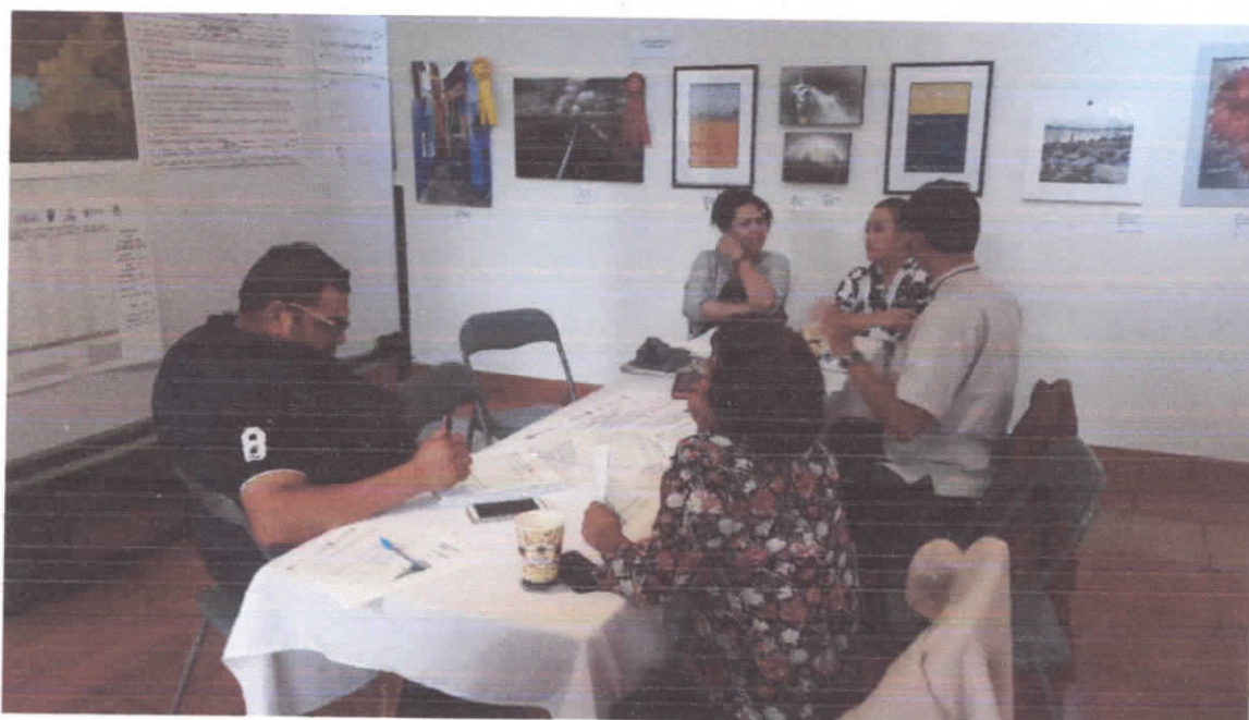
REUNION DEL CONSEJO DISTRICTAL DE DESARROLLO RURAL SUSTENTABLE