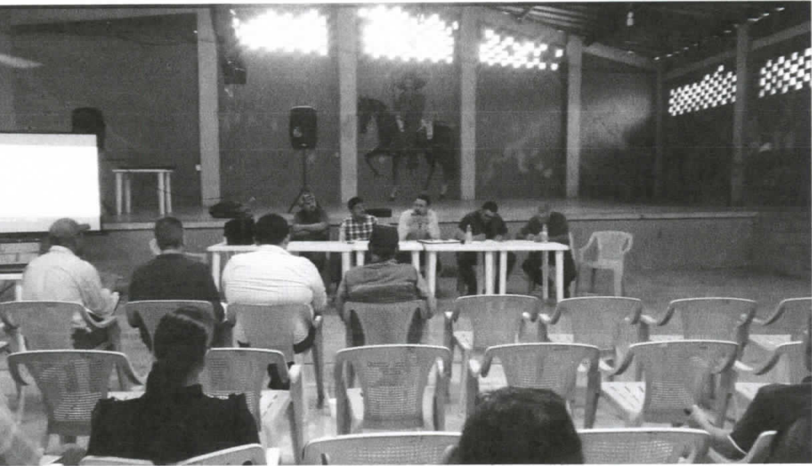
Reunión de AIPROMADES en Chapala.