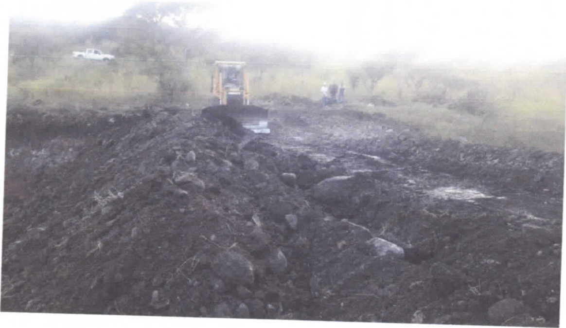
Emparejando el área del PID en la zona federal en Tuxcueca.