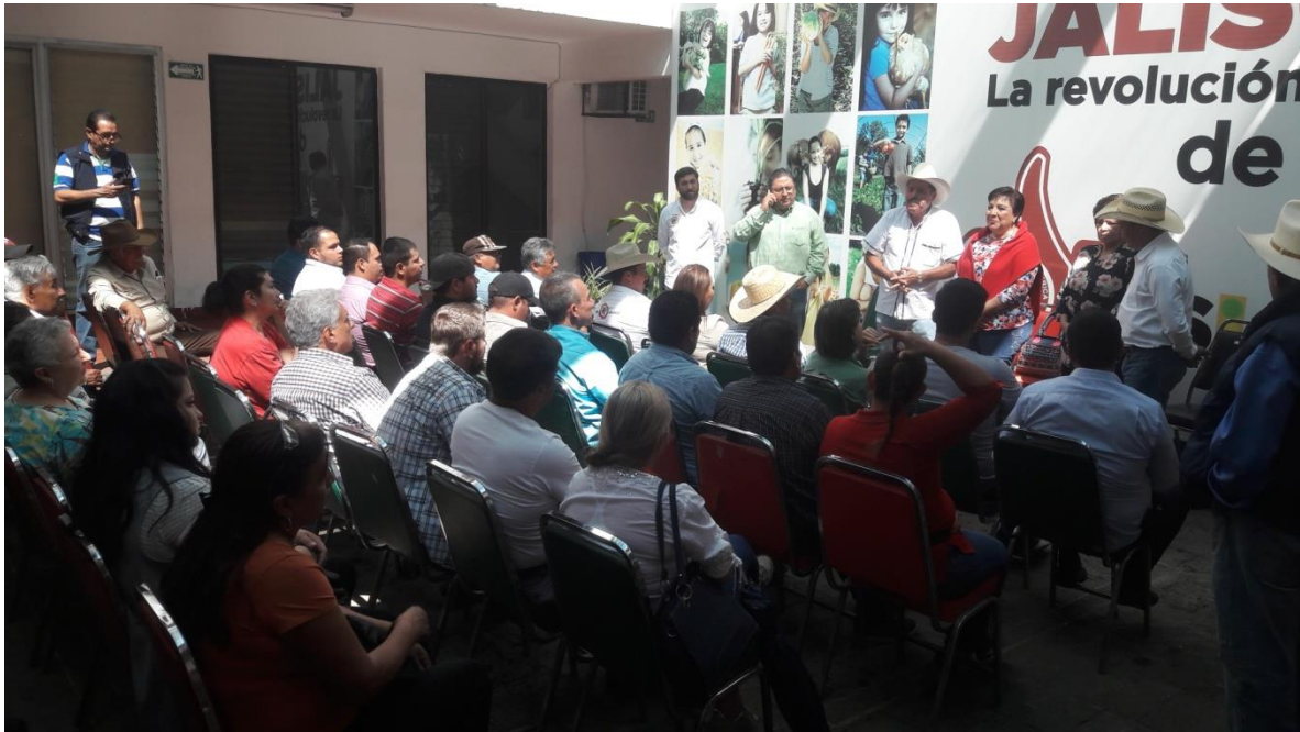
6.- MARTES 20 DE MARZO DE 2018, ASISTENCIA AL EVENTO “FOMENTO AL CONSUMO DE PESCADOS Y MARISCOS” SECRETARIA DE DESARROLLO RURAL, JALISCO.