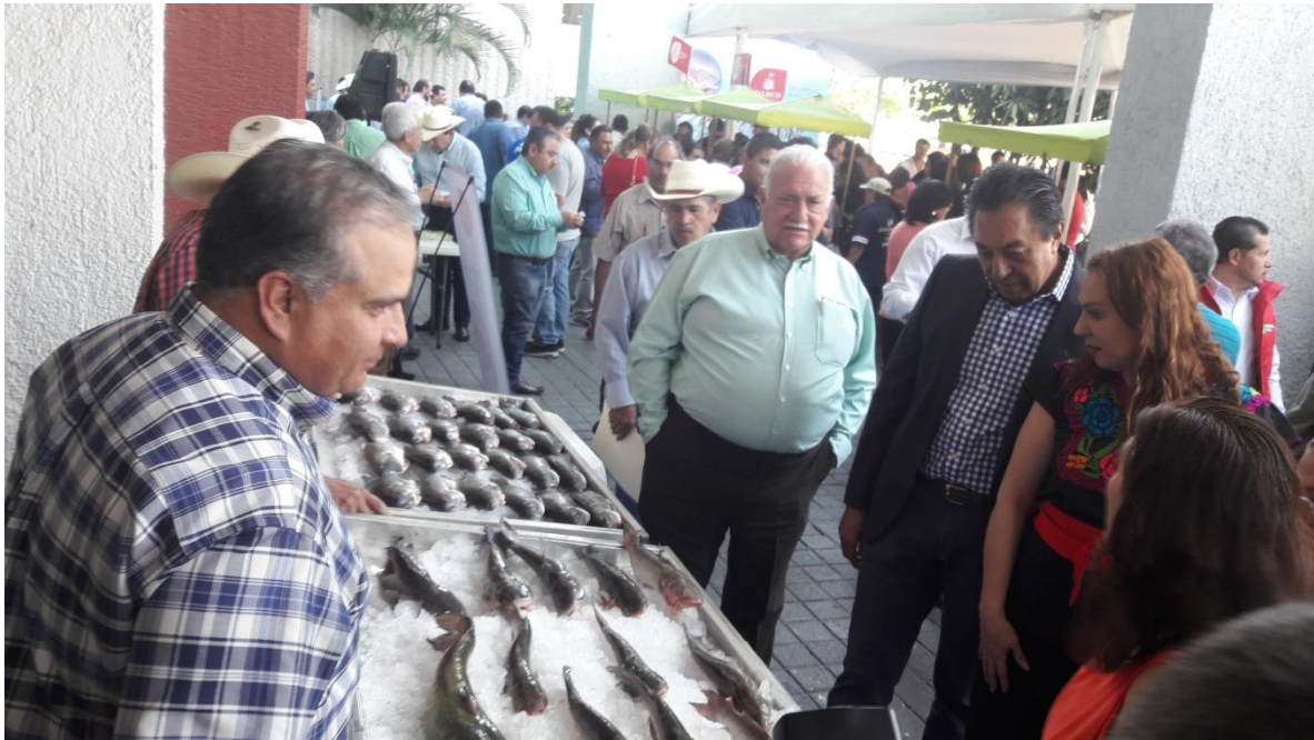
7.- VIERNES 23 DE MARZO DEL 2018, PARTICIPACION EN LA REUNION EXTRAORDINARIA DE LA UNION GANADERA REGIONAL DE JALISCO.