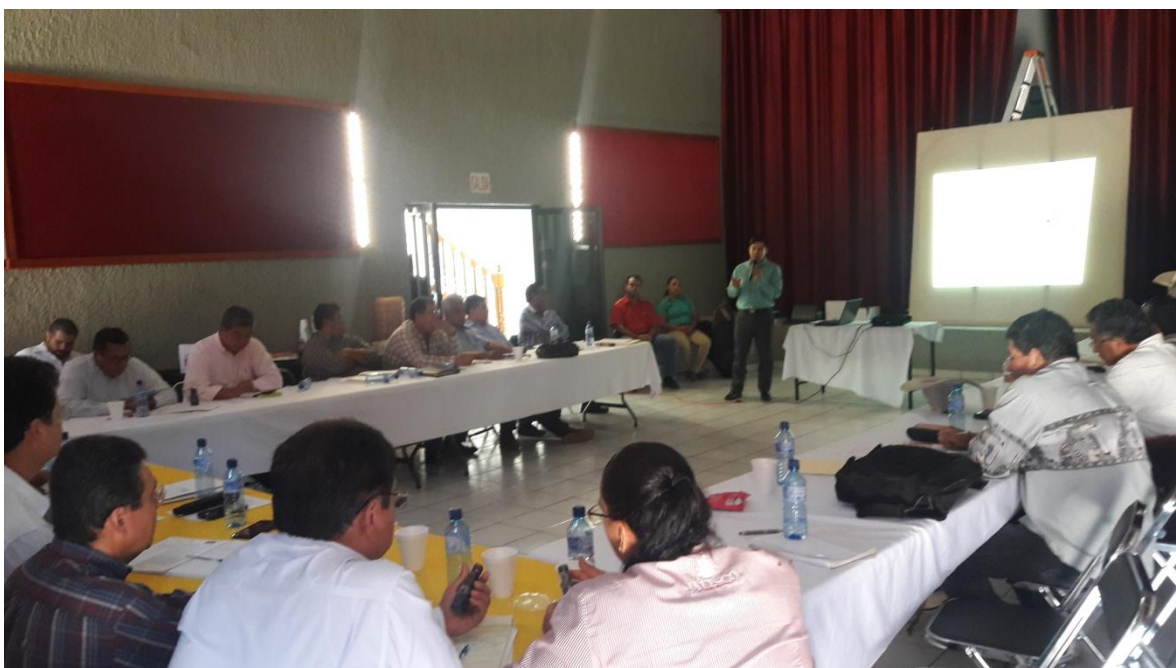
3.- 31 DE AGOSTO DEL 2017, ASISTENCIA A LA CUADRAGESIMA TERCER REUNION DE CABILDO (EXTRAORDINARIA).